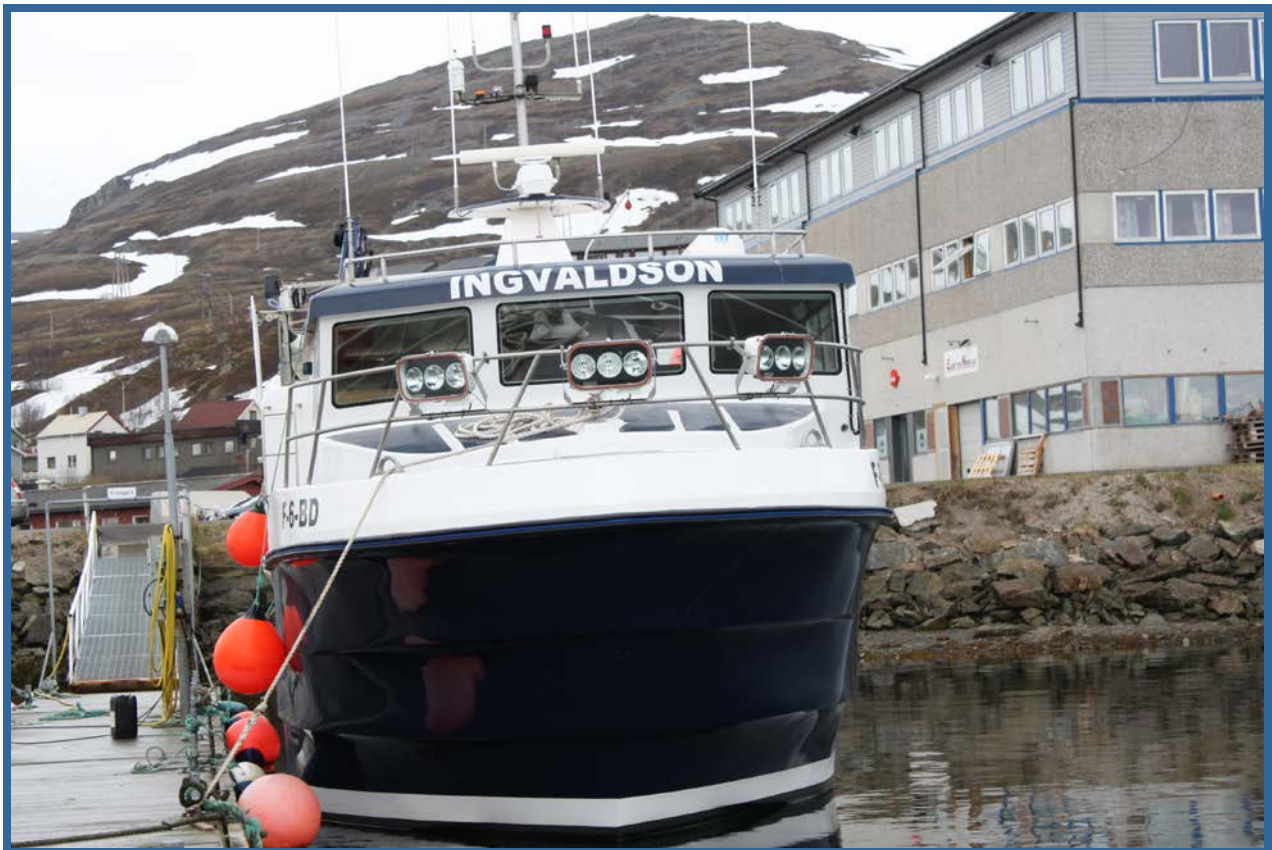
MS "Invaldson" ved kai i hjemnehavnen Båtsfjord.