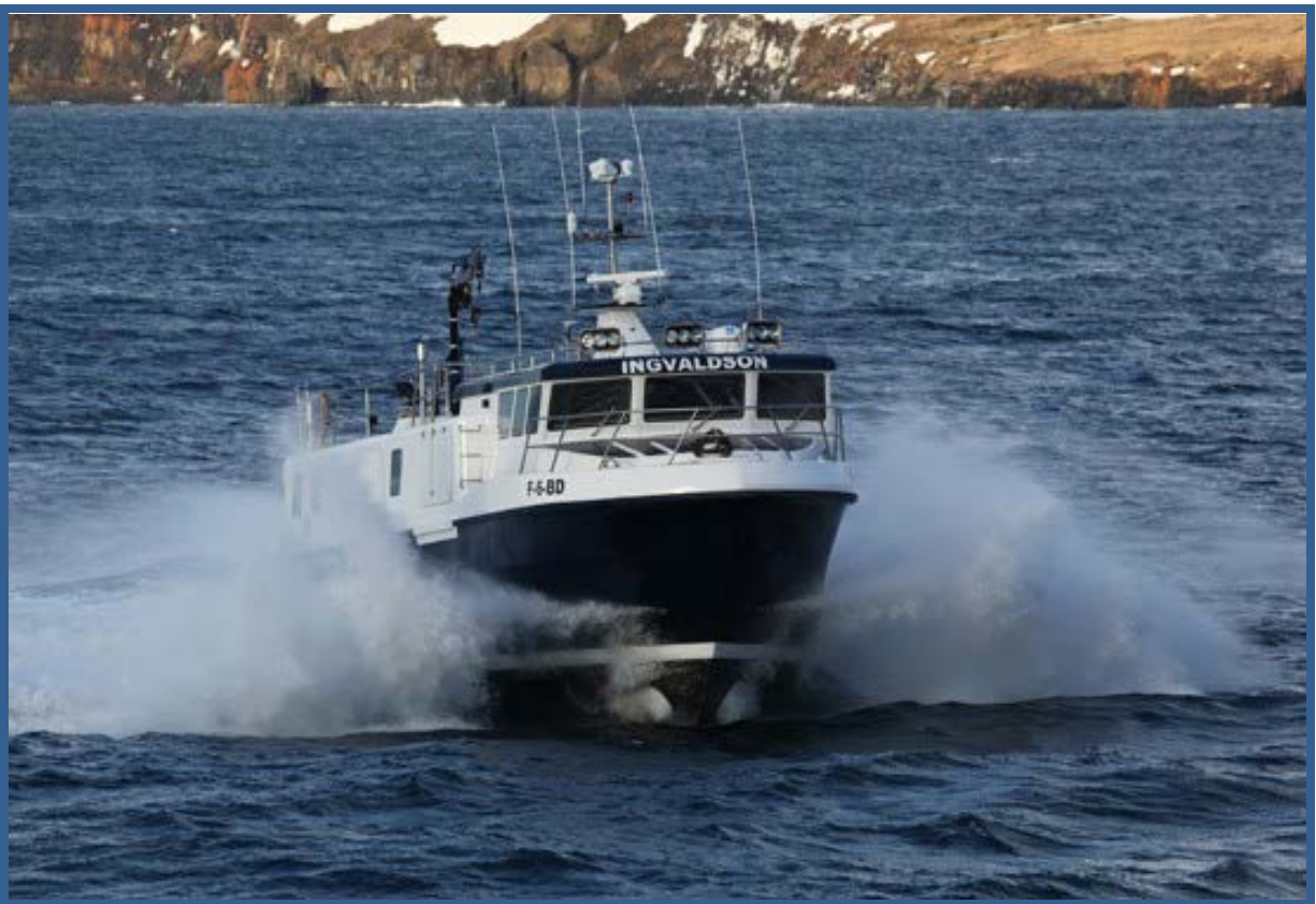
MS "Ingvaldson" er rikt utstyrt med moderne instrumentering. Fartøyet har 2x400 Hk Volvo Penta framdriftsmaskineri og toppfart på prøveturen ble målt til 27 knop.