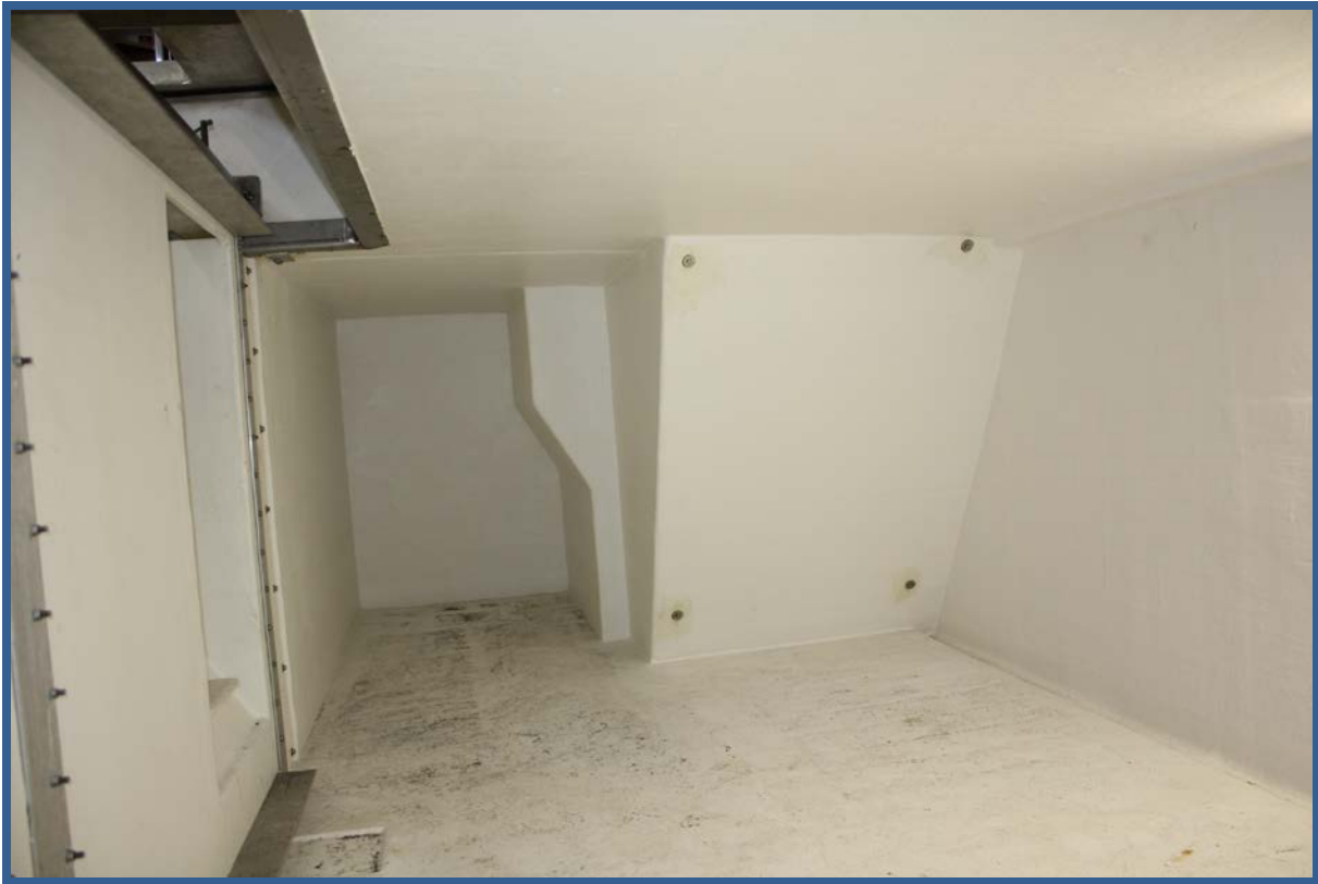
MS “Ingvaldson” på vei hjem fra Island og kort stopp i Tromsø, april 2011. Reder Øyvind Bolle i midten flankert av forskerne Lasse Rindahl (SINTEF) og Ivan Tatone (NFH). På det nederste foto ses utforing for dragebrønnen i forkant av styrbord lasterom.