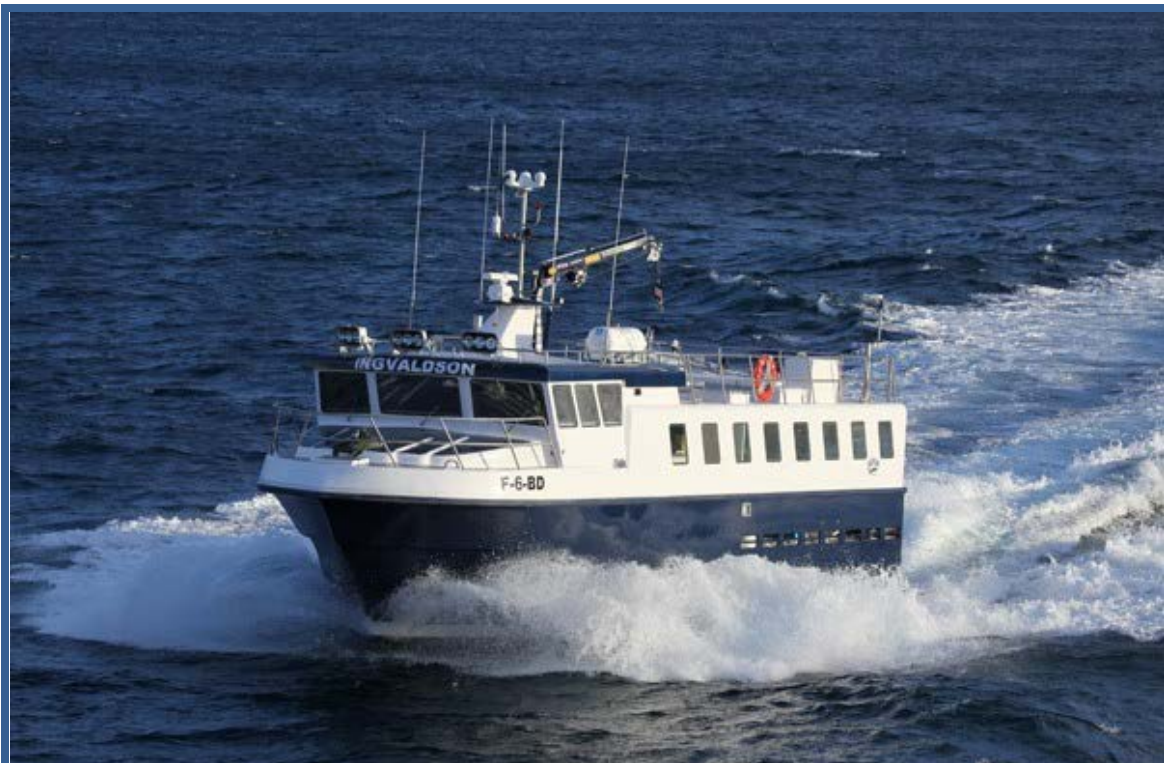
MS “Ingvaldson” under prøvetur ved Akureiri, april 2011.