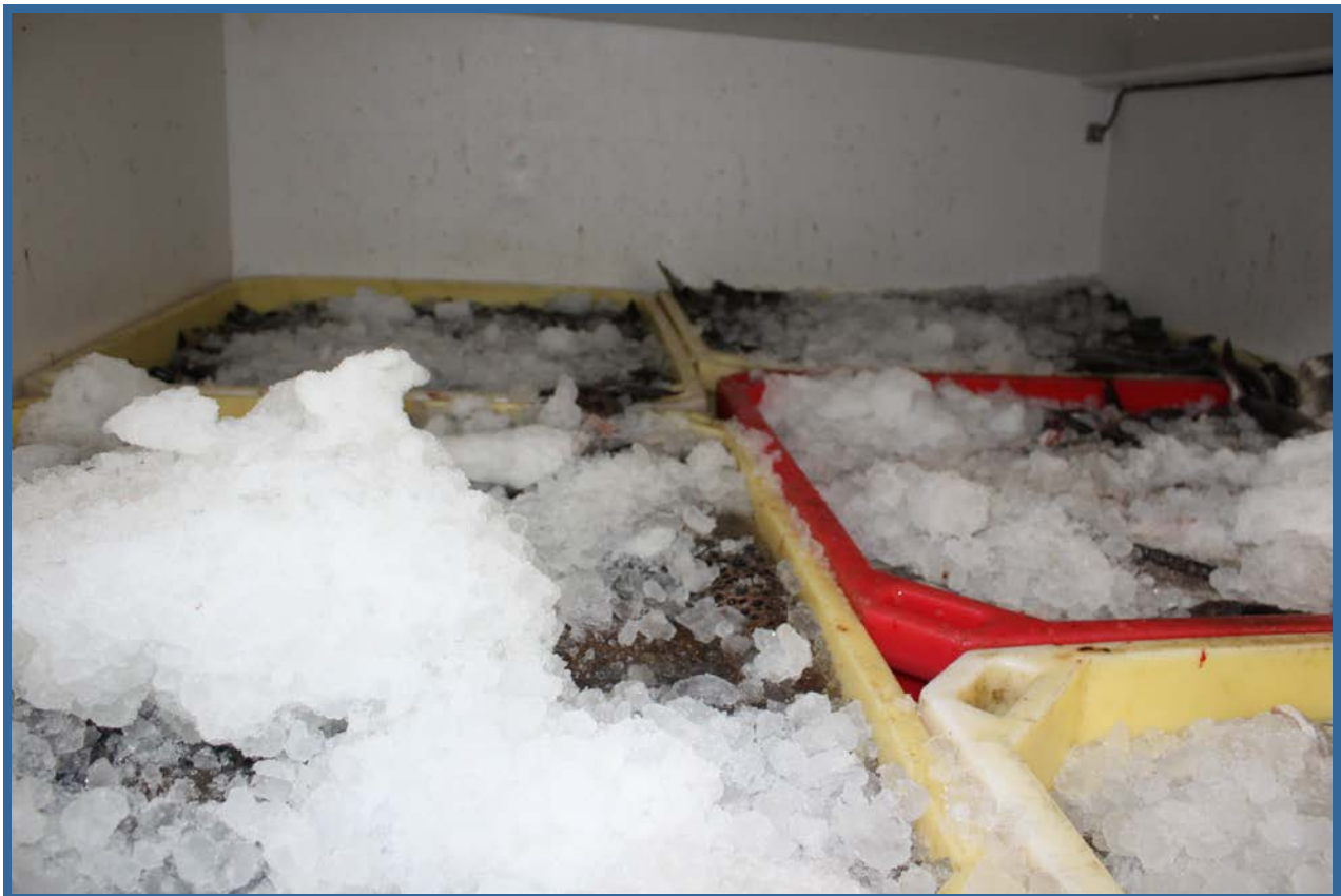
Utblødningstanker og containerlagret fisk i is i lasterommet.