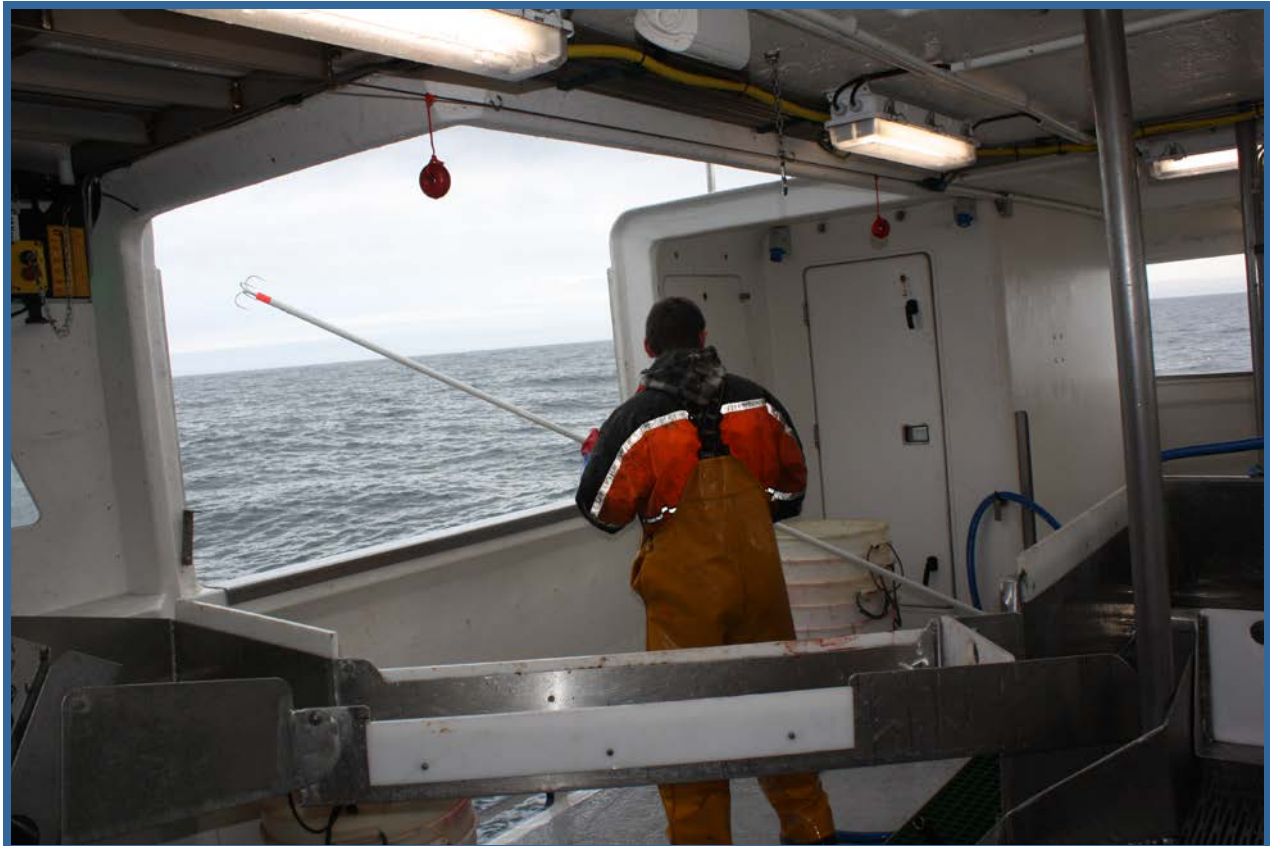
Store flekksteinbit ble avanglet på utsiden av fartøyet og tatt inn med langkroken.