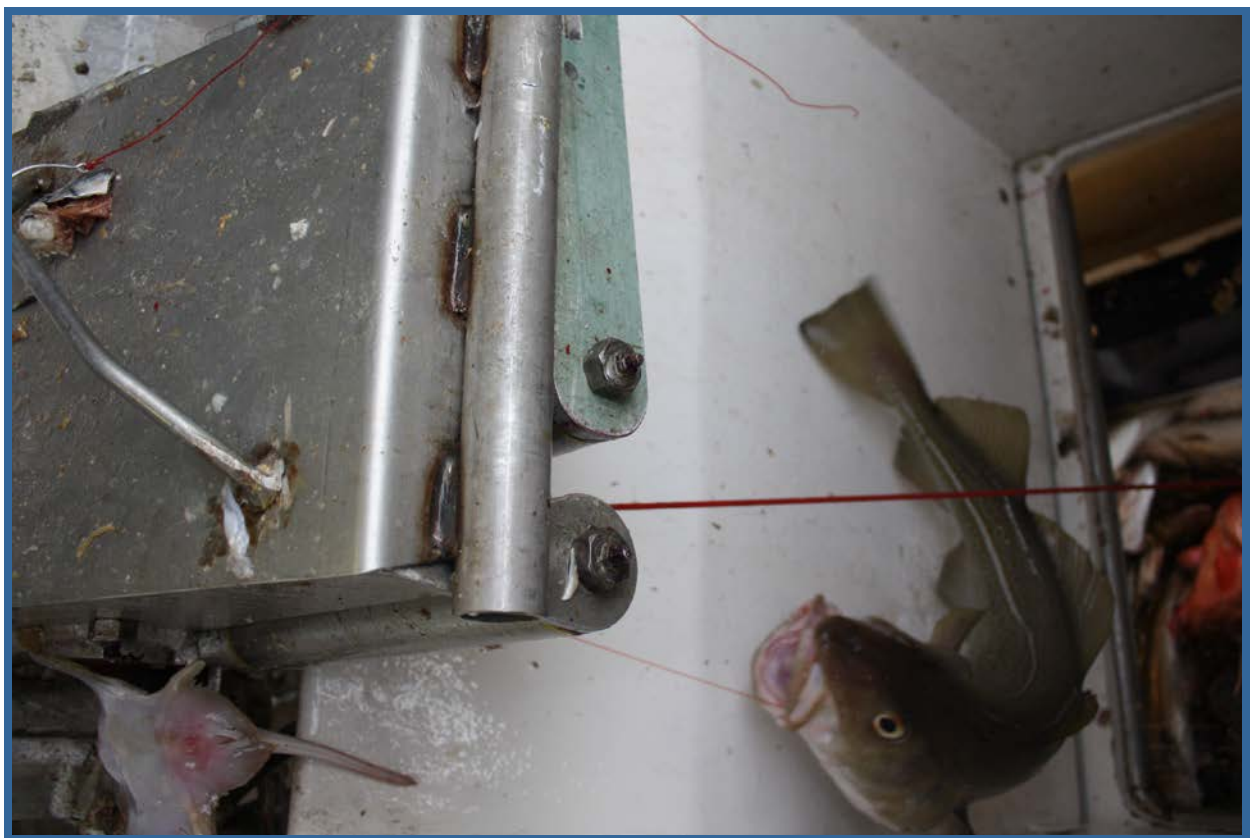
Inne i dragebrønnen og fisk på vei til avangling. Avanglete fisk bringes opp til bløggestasjon med transportør (stålbånd med medbringere).