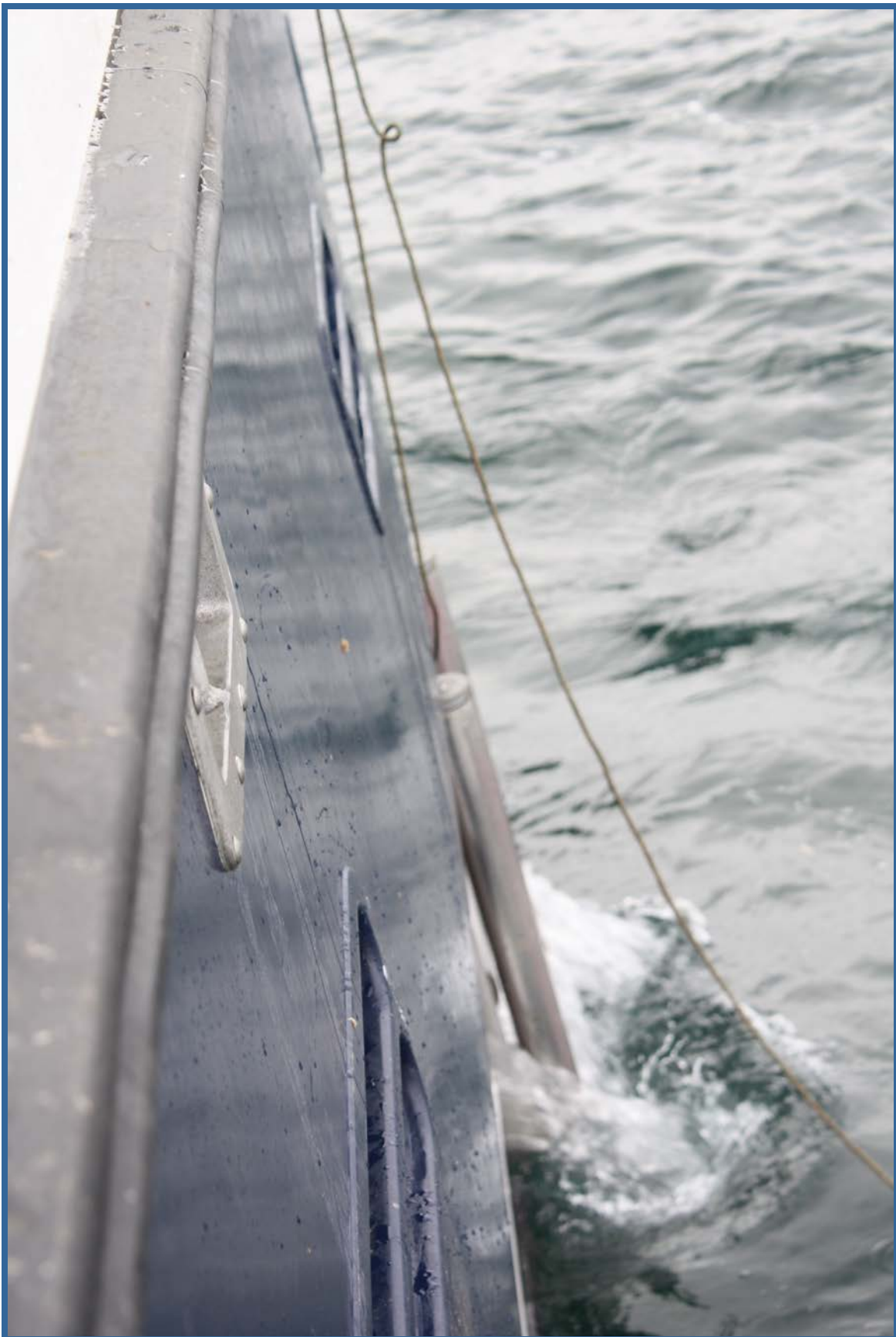
Haling av ilen og kobling for å hale lina gjennom dragebrønnen. Nedre kant av de vertikale rullene i drageluka og lukas nedre kant ligger rett under vannspeilet.