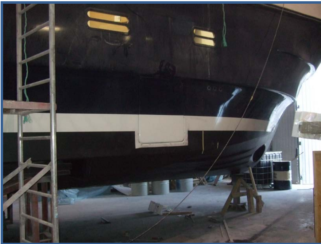
MS "Ingvaldson" under bygging på Seigla Ehf, Akureiri, februar 2011. På det nederste foto ses plassering av drageromsluka.