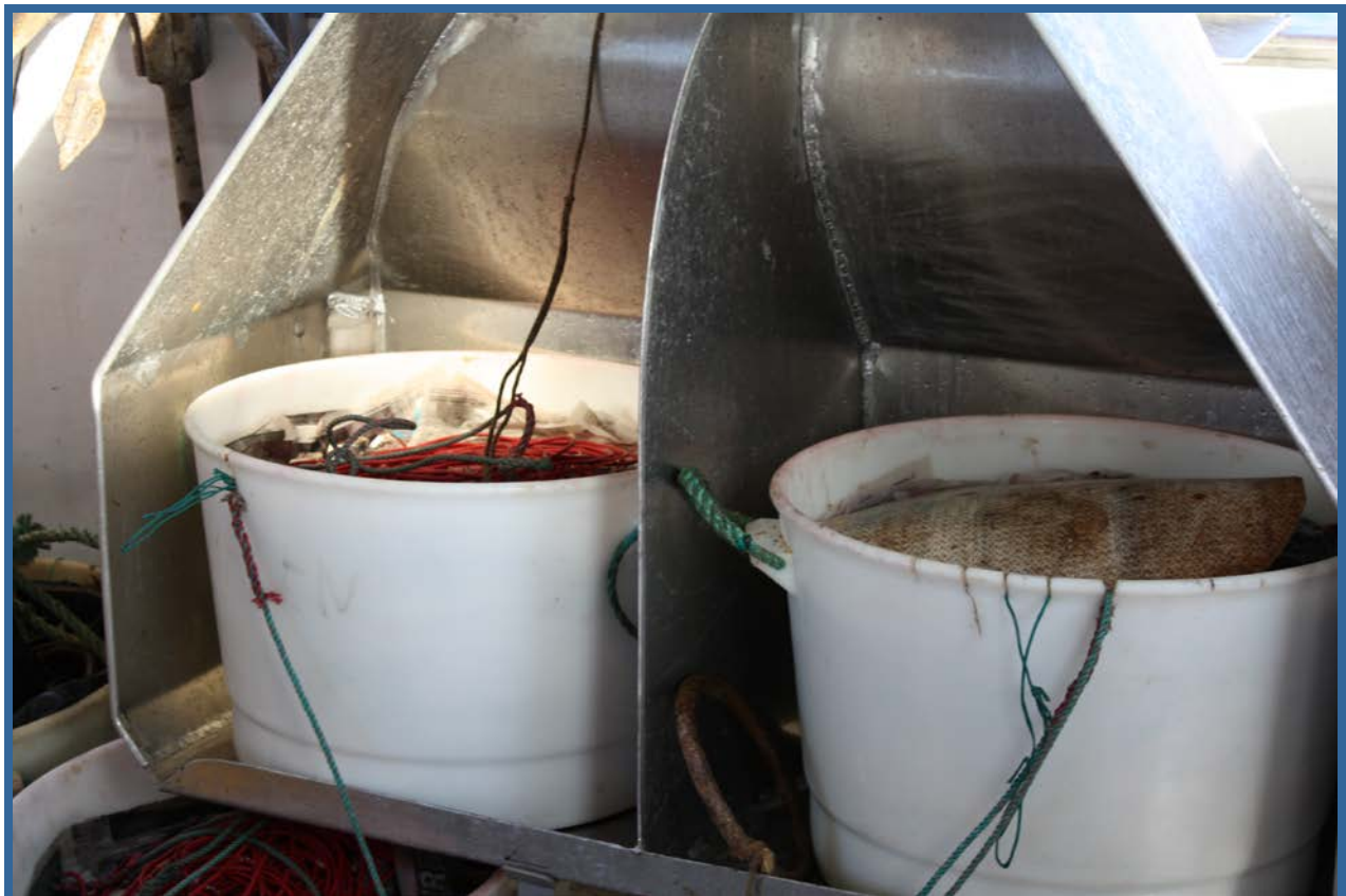
Setting av lina. Det blir brukt ca. 60 stamper line (á 330 krok) i banklinefisket.