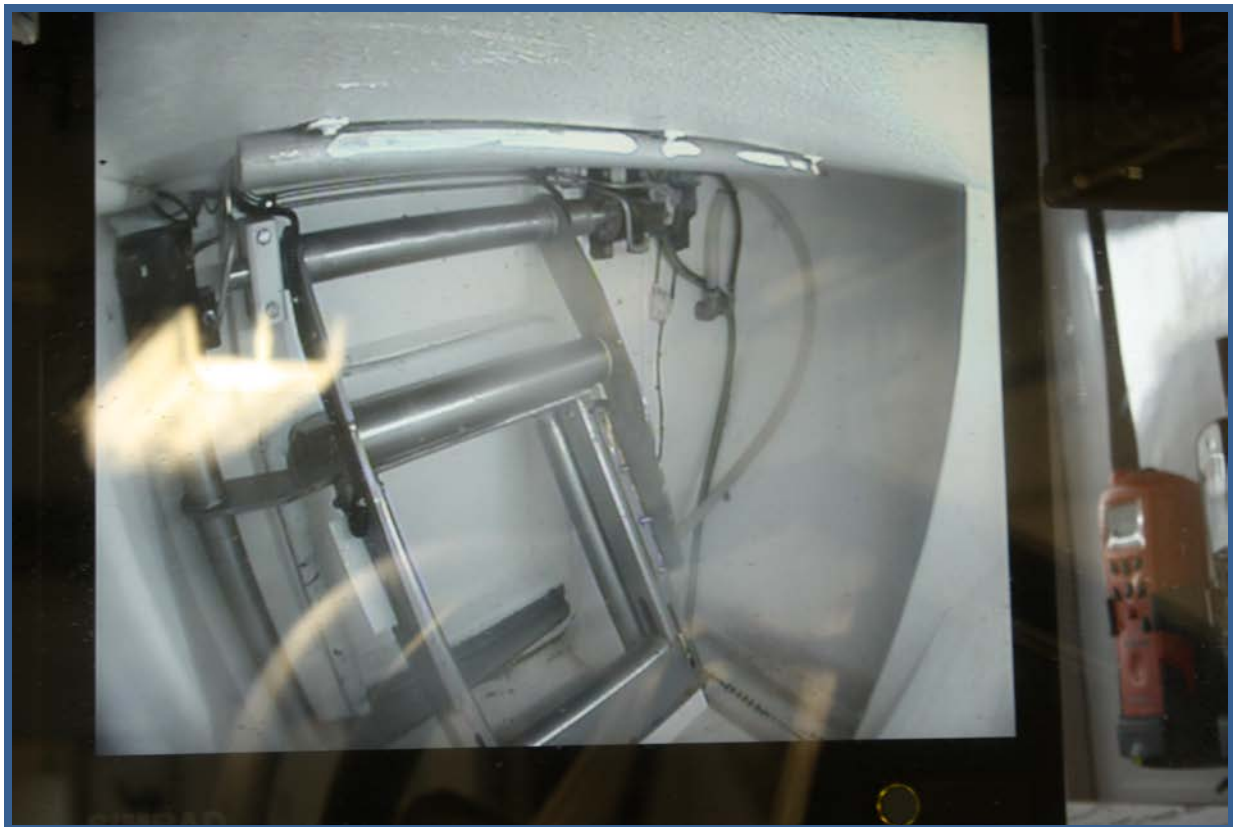
MS “Ingvaldson” er utstyrt med kameraer i ulike posisjoner. Skjermen viser i dette tilfellet bilde fra kamera inne i dragebrønner og hvordan systemet er plassert under fart. På det nederste foto ses bilde fra skjerm som er plassert på dekk.